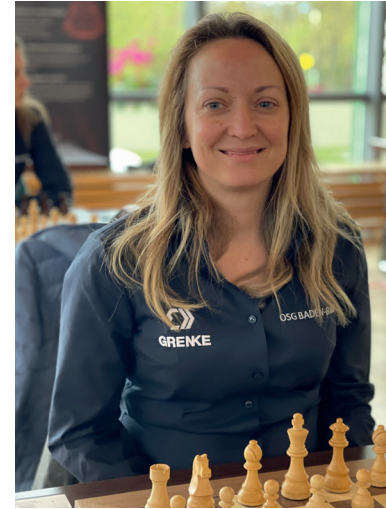
GM Elisabeth Pähtz

Um das besondere Jubiläum gebührend zu feiern, richten wir im Rahmen des Emsdettener Septembers am 29.09.2024 ein gleich doppeltes Simultanturnier aus: Elisabeth Pähtz, Großmeisterin und stärkste deutsche Schachspielerin, aktuell die Nr. 20 der Weltrangliste, wird gegen 20 hiesige Recken gleichzeitig antreten und dabei ebenso ihre strategischen Pläne demonstrieren wie Leonhard Ortmeier, der sich der Herausforderung unserer aktuellen Jugendspieler stellen wird. Eine Gelegenheit für alle Schachfreunde, die Faszination des königlichen Spiels hautnah zu erleben.